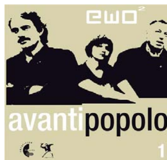
ewo2 - »avanti popolo1« KreativTon/JUMPUP - JUP-015 In den Top 10 der Liederbestenliste, Juni 2008