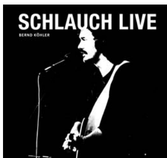
SCHLAUCH LIVE – DAS HARTMANNSTRASSEN-KONZERT 1989 KreativTon/JumpUp - JUP 011