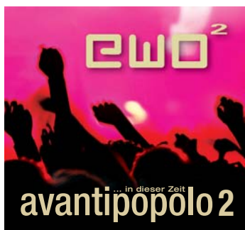
ewo2 - »avantipopolo2« Plattenbau/JUMPUP - JUP-019 Ausgezeichnet mit dem „Preis der deutschen Schallplattenkritik“ 4/2009